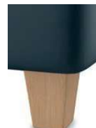
H17-10 H17-15 Holzfuß Buche natur lackiert