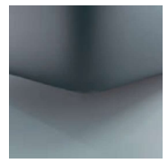
K08-10 K08-15 Schwebeoptik