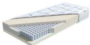
MA 350 / MS 358