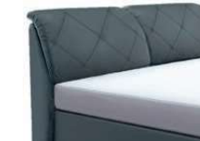
0853 Höhe 112 cm