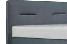
0800 Höhe 126 cm