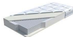
MA 420 / MS 428