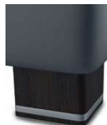
H 05-10 H 05-15 Holzfuß wengefarbig