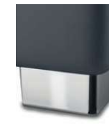
M 09-10 M 09-15 Metallfuß verchromt