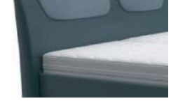
0835 Höhe 117 cm