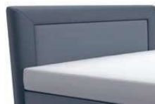
0025 Höhe 122 cm