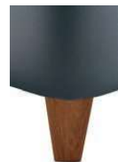
H25-10 H25-15 Holzfuß Eiche natur geölt