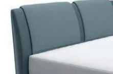
0817 Höhe 116 cm