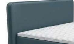
0383 Höhe 116 cm