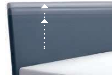
0300 Multimaß Höhe 55 - 125 cm in 5cm-Schritten kürzbar