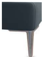
A11-10/M12 A11-15/M12 Alufuß gebürstet