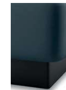
S08-10 S08-15 Bettsockel schwarz