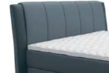
0378 Höhe 116 cm