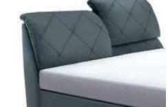
0853KV Höhe 112-123 cm nur lieferbar bei Bettgrößen 160-200cm Breite