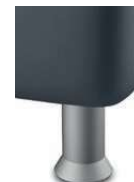
K01-10 K01-15 Kunststofffuß alufarbig