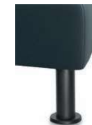
M24-10 M24-15 Metallfuß schwarz