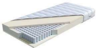
MA 222 / MS 228