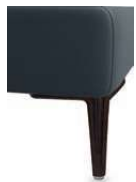
A11-10/M01 A11-15/M01 Alufuß schwarz matt